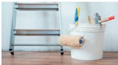
LES PEINTURES, VERNIS, COLLES...