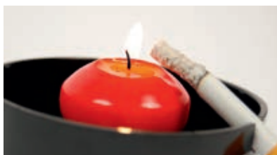
LES FUMÉES DE BOUGIES, FEUX, CIGARETTES OU CUISSON