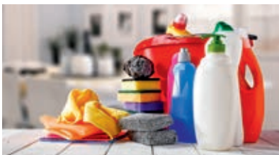
LES PRODUITS DE NETTOYAGE, D'ENTRETIEN...

Les causes sont nombreuses et font partie de notre environnement quotidien :