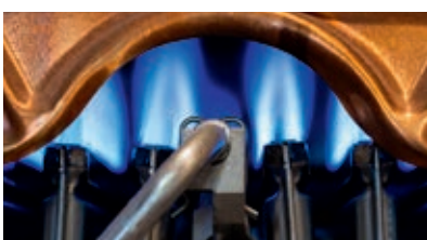
LA COMBUSTION (CHAUFFAGE)